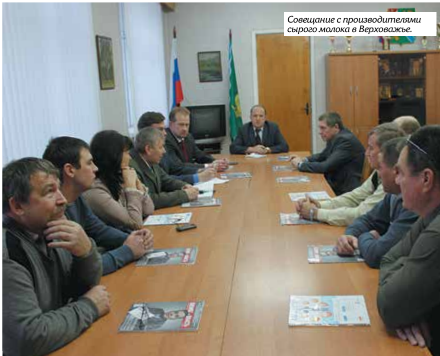
Совещание с производителями сырого молока в Верховажье.

лесосеки. В итоге, бизнесмены приобрели или обновили технику и оборудование, в молочном животноводстве появилась положительная динамика.