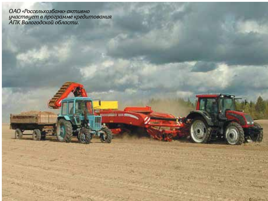
ОАО «Россельхозбанк» активно участвует в программе кредитования АПК Вологодской области.

— Главной задачей филиала я вижу повышение качества обслуживания клиентов и доступности наших продуктов. Здесь нам еще есть что совершенствовать. Сюда я отношу и непосредственное обслуживание клиентов на операционной линии, и скорость принятия