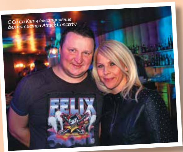
Си Си Кэтч (выступление для артистов Attack Concerts).

☎ (8172) 587-587 ✉ Promo.djparade@yandex.ru