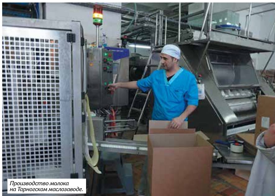
Производство молока на Тарногском маслозаводе.

Думаю, недалеко то время, когда и Россия подойдет к зарубежному методу поддержки АПК, то есть к дотациям на конкретный вид продукции. А пока что за наши предыдущие ошибки придется расплачиваться нашим потомкам. 59