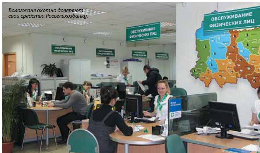
Вологжане охотно доверяют свои средства Россельхозбанку.

На сегодняшний день доля Россельхозбанка в регионе по кредитованию юридических лиц составляет 12%. Сохранить одну из ведущих позиций в данном сегменте нам удалось благодаря этому плотному взаимодействию с нашими клиентами.